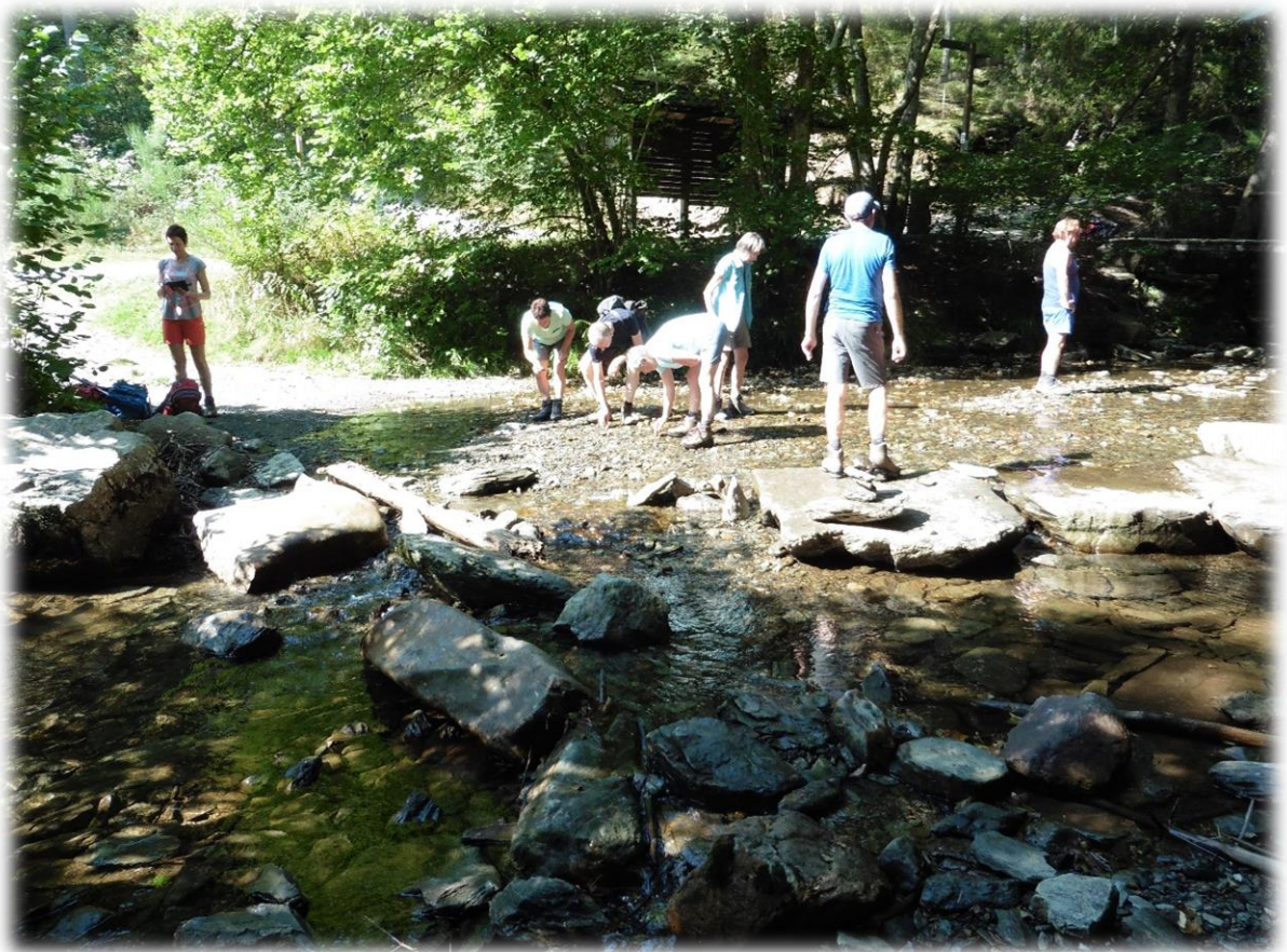
Er wordt hevig gezocht naar goudklompjes. De zoektocht was echter tevergeefs.