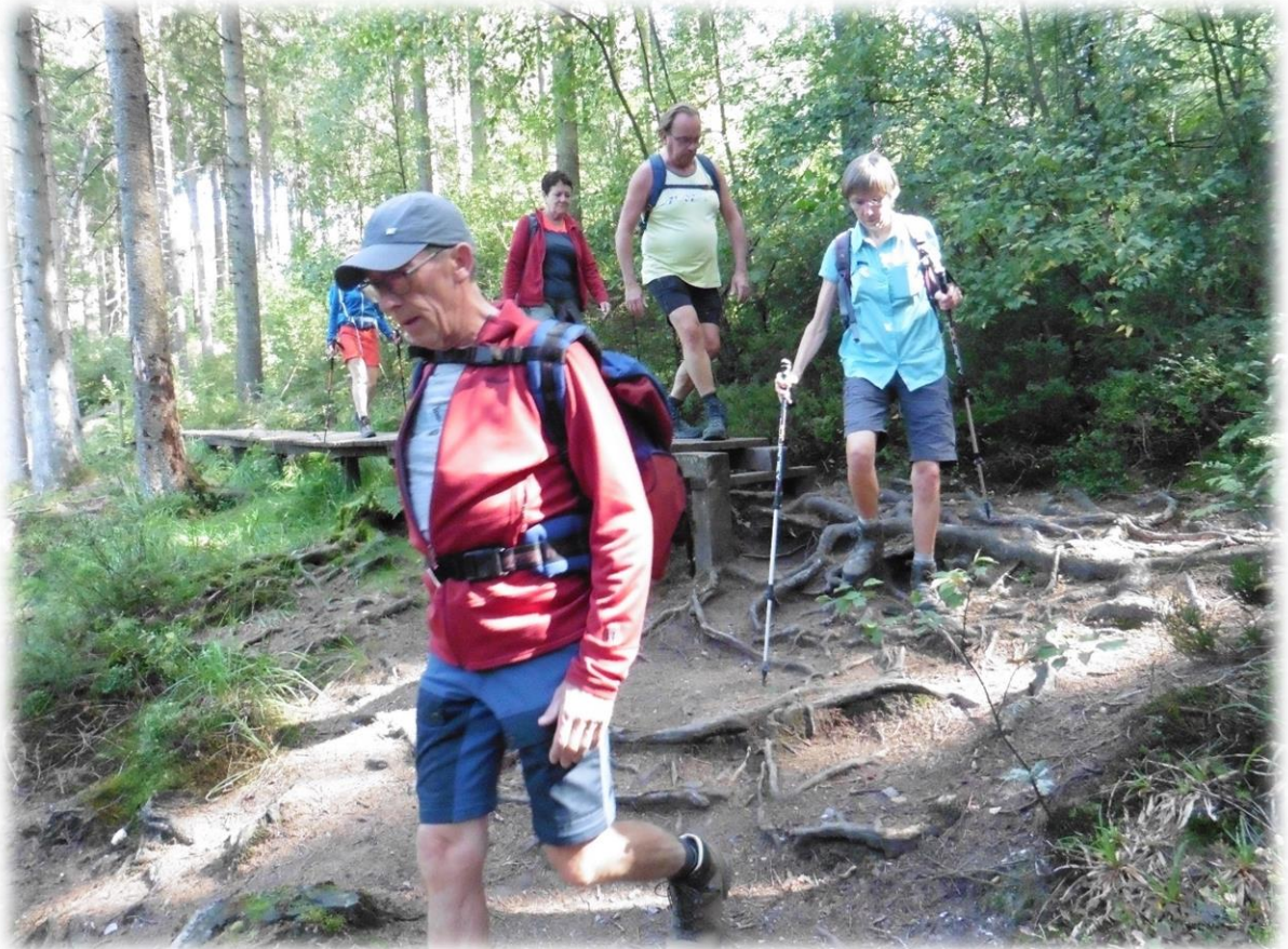
Het is steeds wat klimmen en wat dalen, door heide en door bossen.