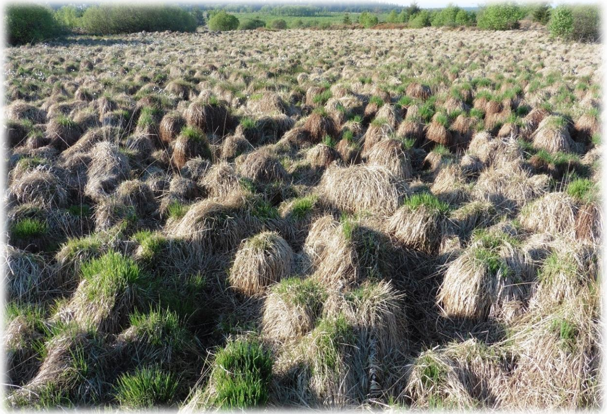
Foto hierboven is het pijpenstrootje in het voorjaar. Hier kan je duidelijk zien dat het pijpenstrootje groeit op bulten. Het is nagenoeg onmogelijk om een gebied waar het pijpenstrootje voorkomt te doorkruisen als er geen paden zijn.

Vroeger werd het gras gebruik voor vlechtwerk. Ook werden er bezems mee gemaakt. En uiteraard werd de binnenkant van de steel van de pijp hiermee ook gereinigd.