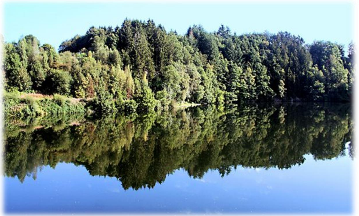
Het meer van Robertville heeft een oppervlakte van 62 hectare (of 0,62 km 2 ). De dam werd aangelegd in 1928 en heeft een hoogte van 55 m boven de Warche. Het stuwmeer voorziet Malmédy van drinkwater en is tevens een waterreservoir voor de elektrische centrale in Bévercé.