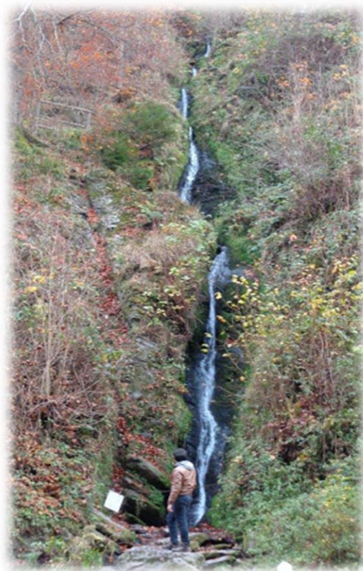
De waterval van Reinhardstein. Het water valt 60 m diep in de vallei van de Warche en is meteen de hoogste waterval van België.