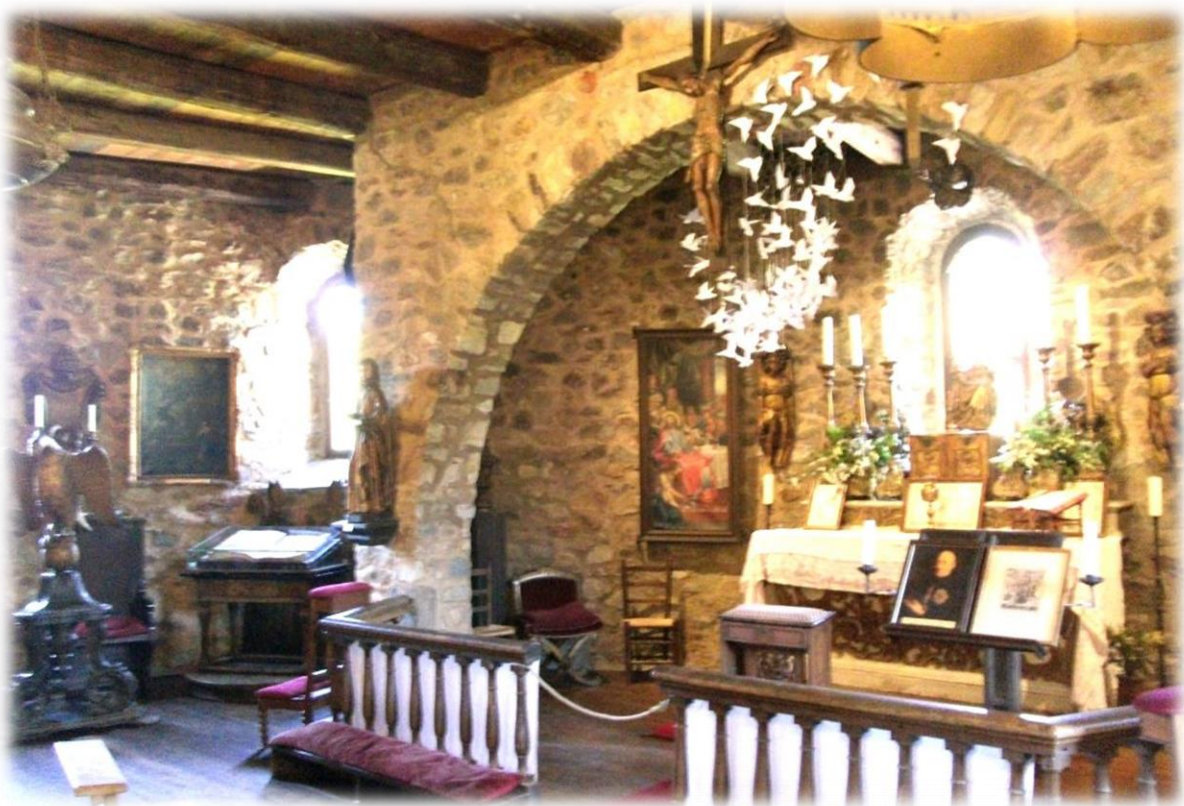
Kasteel Reinhardstein. Het kasteel, vandaag uniek in België, werd opgetrokken in 1354. Nadat het was vernield, werd het vanaf 1969 herbouwd in overeenstemming met